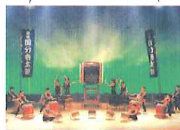
讃岐国分寺子供太鼓

主催 音の祭り実行委員会 (国分寺まちづくり協議会、国分寺南部校区コミュニティ協議会、国分寺北部校区コミュニティ協議会、高松市) 協力 高松国分寺ホール指定管理者 (日本管財・JTBコミュニケーションデザイン共同事業体)