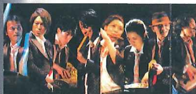
AUN J CLASSIC ORCHESTRA

AUN J (あunjい)クラシック・オーケストラは、各楽器の第一線で活躍する邦楽家たちによる和楽器のみのユニット。伝統と革新を高いレベルで両立させたクオリティとパフォーマンス性は、海外においても高い評価を得ており、世界各国で日本文化の普遍性や多様性を発信している。第15回の音の祭りに出演し、今回は2回目の登場。