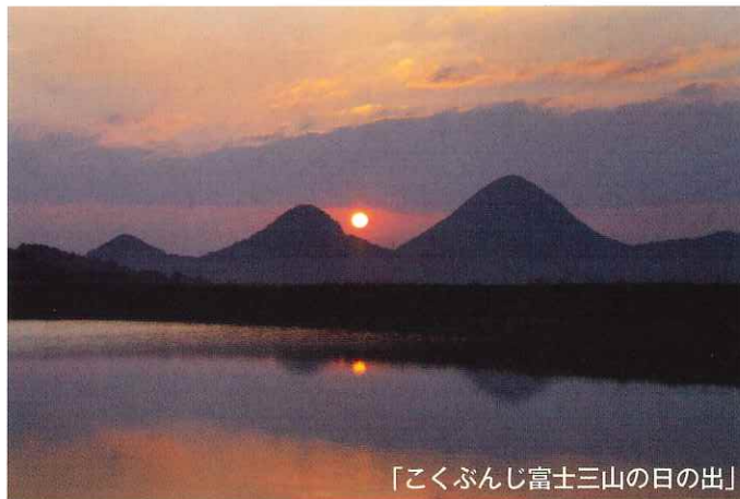
「こくぶんじ富士三山の日の出」